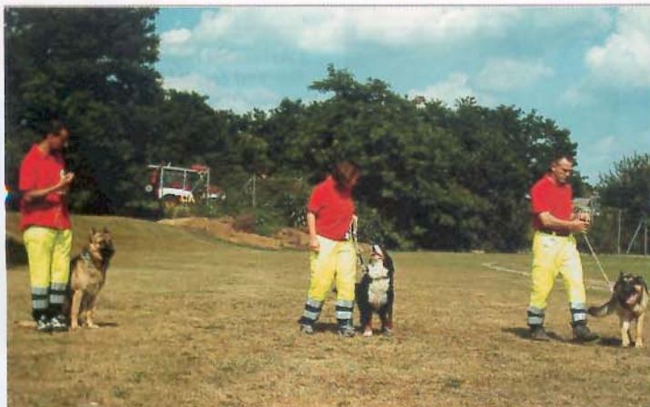
Esercitazioni con il gruppo cinofilo