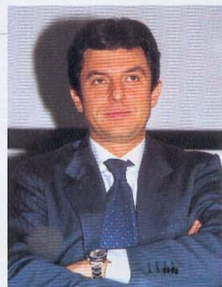
Massimo Buscemi, Assessore alla Sicurezza, Polizia Locale e protezione civile della Regione Lombardia

e Cva Angera, dai gruppi comunali di Fagnano Olona e Jerago con Orago, dall'unità cinofila di Vedano Olona, dal Gruppo Speleologico di Fagnano Olona e infine, dalla Croce Rosa Celeste di Milano. Nel corso delle giornate sono intervenuti Massimo Gerosa, Responsabile della protezione civile di Anpas Lombardia; Olinto Manini, Sindaco di Malnate e Christian Campiotti, Assessore provinciale alla pro-