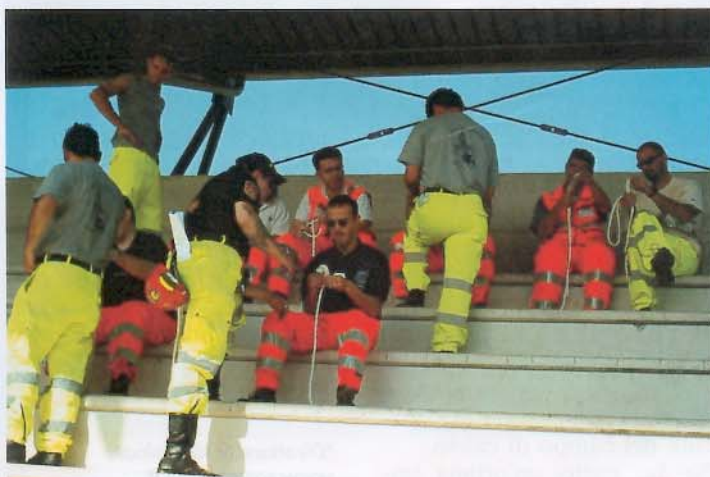
Preparazione al montaggio delle tende