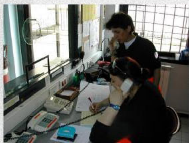
Prenotazioni servizi di trasporto in ambulanza