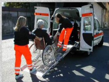
Trasporti con mezzi speciali